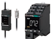
电机状态监视设备 K6CM系列