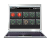
利用Monitoring Tool 将状态可视化