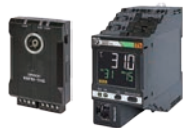
温度状态监视设备 K6PM系列