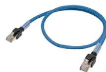
RJ45连接器 电缆 XS系列